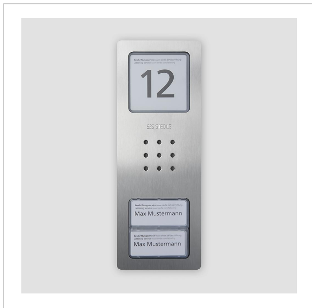
Audio-dørstation Siedle Compact CA 850-2 E 210008734-00